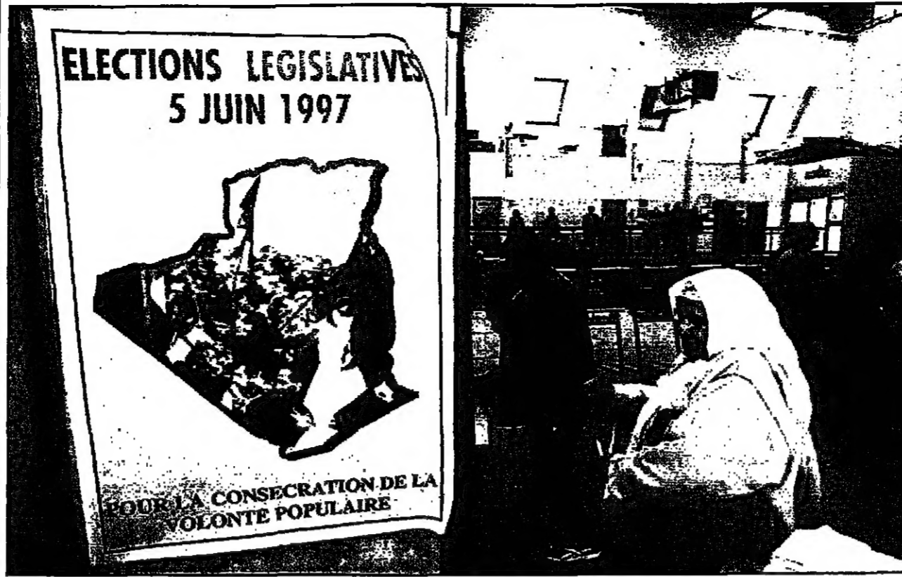
سيدة جزائرية تدلي بصوتها في مدينة تيس الفرنسية (روبير)